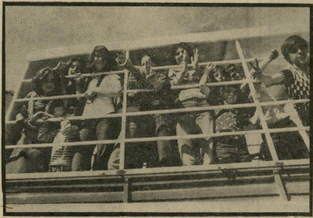
נערות במשאית בדרך להפגנה בדם ורוח נפדה את הגליל

יש פה ילדים, אז לא תהיה מהומה. אני מנסה להרגיע את עצמי. אני מודה שאני חוששת. אזהרת המישטרה והורם האדיר של תושבים ערביים נושאי השלי' טים, הצועקים בקולי קולות: „בדם וברוח נפדה את הגליל!" עושים את שלהם. גילה מנחשת שלא יהיה אף שוטר אחד בתוך הכפרים. אני משוכנעת שהמקום יהיה מוצף בשוטרים ובחיילים. אחר-כך מסתבר שגילה צדקה. המישטרה נהגה ב' תבונה. אף לא שוטר אחד, אף לא איש מישמר-גבול אחד נראה בהשט שבו התקיימה התהלוכה וההפגנה. האירגון מופתי. בערבה יורדת