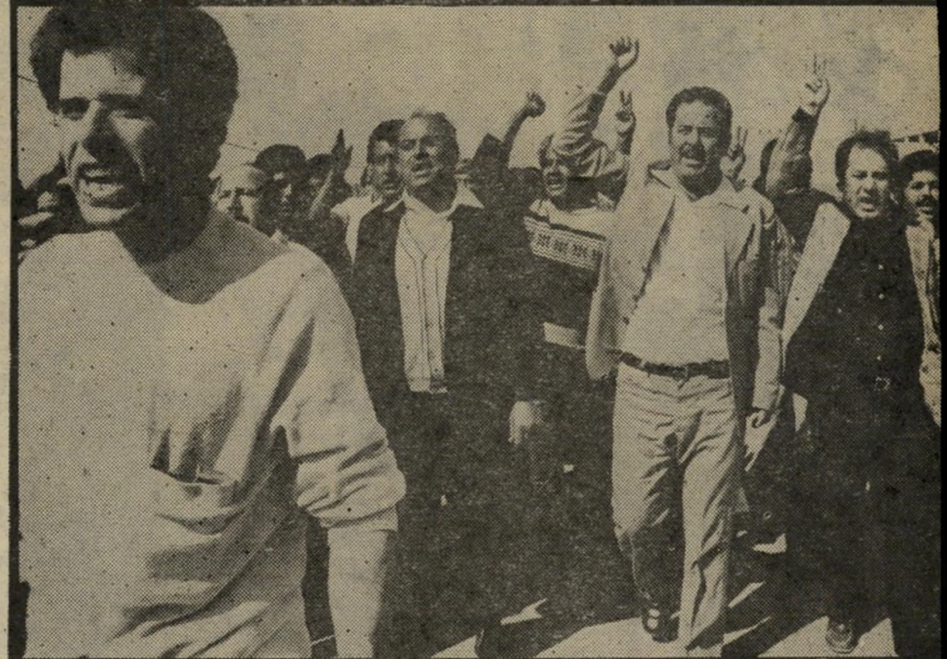
נפדה את הגליל, קוראים גברים ערבים שירדו מהגבעה והציטרו לתהלוכה. אלפים הגיעו לעצרת מנצרת ומהכפרים סביב. טקסים נוספים התקיימו בכפר קנא ובכפר יטיף שבגליל, אך העצרת הגדולה הייתה בסכנין.