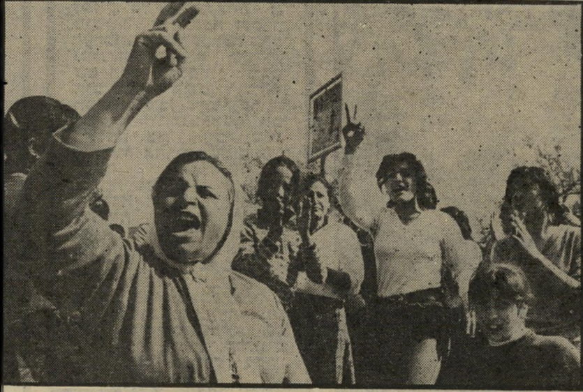
„בגין החוצה!“ צועקות נשים ערביות שעמדו בשולי התהלוכה שהלכה מכפר דיר-חנא דרך הכפר ערבה לכפר סכנין, שם, למרגלות האנדרטה לזכר חללי יום-האדמה הראשון, נערכה העצרת המרכזית.