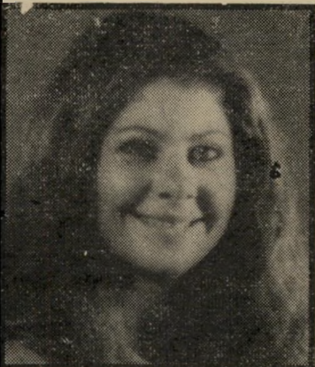
שחקנית שיי גם בעתיד

לא רק שאני שחקנית לשעבר, אם גם בהווה וגם בעתיד הרחוק.