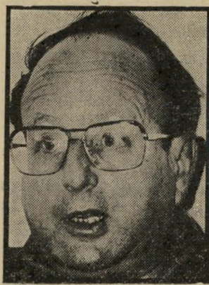
מומציא ברמן לא-אשם?

רת נוהגים על-מירוב כסוחרים המשתדלים לספק את מאוויי צר-כניהם תוך עיוות או סילוף המא בק למען האמת, הצדק, השוויון, ההגינות וכו'.