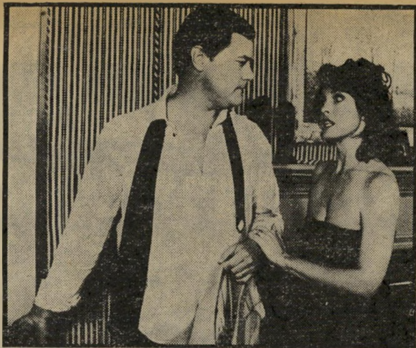
סראקן ג'יניאר אחות המאהבת והבעל

אם מר ברמן ומר מרידור אש-מים - נניח - בשורה שלמה של אשמות, יוטל-נא עליהם העונש המתאים לפי החוק - אך הגאמ'נות להגיון הישר ולאמת מחייבת להתייחס להמצאה לגופה, לפי קריטריונים מדעיים וכלכליים