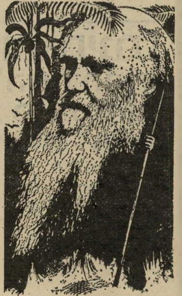
ארנסט דארווין היבטים שונים של האבולוציה

המדובר בספרים העוסקים בהיבטים שונים של האבולוציה הדארווינית — צמחים, בעלי-חיים, קופים והמעבר לבני-