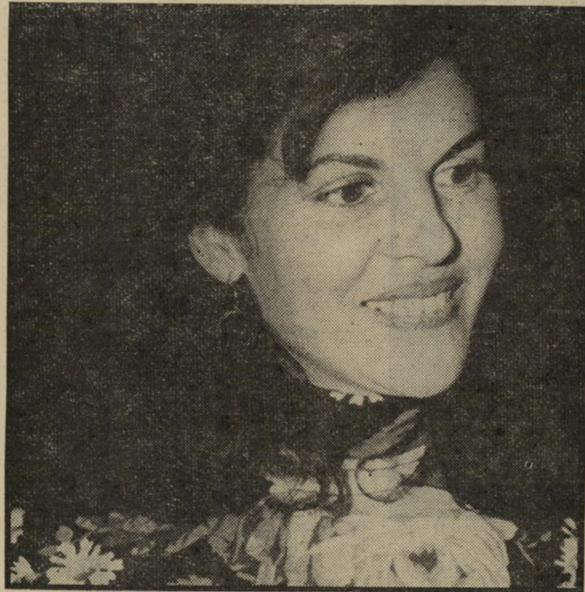
אשת-הנשיא אופירה נבון אסור לשנות טעם?

לדעתי, תגובתו של האופנאי היא מרושעת ובלתי-אובייקטיבית, ואני מרגישה פגועה. בתור מעריצתה של אשת-הנשיא המדינה אני עוקבת אחרי מאמרים המתפרסמים אודותיה, ולכן ידוע לי כי היא