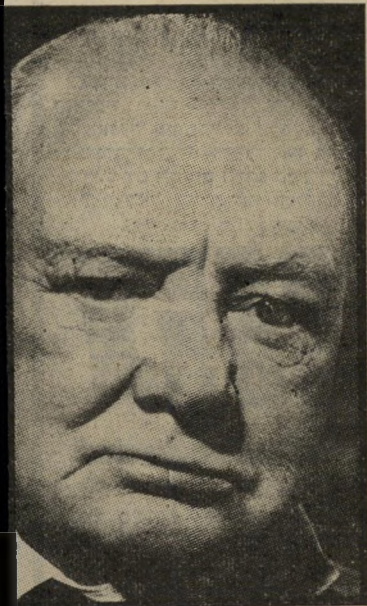
מדינאי צירציל יאלטה יוק