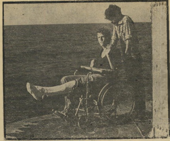
נשר ומוג'יה: להתבגר מהר מדי

דותן מצליח להעביר היטב את העיוות הנפשי שחל