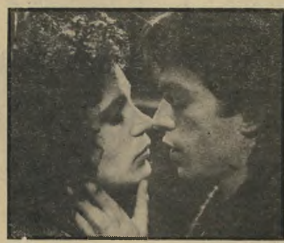
נימן ורול: עולם סגור

אלף נשיקות קטנות (מוסר-און, תל-אביב, ישראל) — העי-צוב האמנותי של הסרט הוא מעלתו הבולטת ביותר. כל תמונה ותמונה תוכננו בקפדנות ובאהבה רבה, ואין ספק שעין מאומנת היטב באמנות הפלאסטית השגיחה כאן על הנעשה. ואומנם, התפאורה והתאורה משרתי סיוטר מכל מר-כיב אחר את הסיפור על יחסיהן של אם ובתה, המגיעים לשיא אחרי מות האב. אז מסתבר שלמנוח היו חיים כפרי-לים, ולצד משפחתו החוקית, הוא החזיק אשה אחרת, אם לבן שהוא אולי בנו ואולי לא. הבת החוקית, עלמה, משתוקקת מאוד לחדור לסוד חייו של האב ולחשוף את האמת. אמה, רוטה, מנסה לאחוז בה בכל כוחה, בתערובת של סחטנות רגשית, שתל-טנות והתרמסות, ולמנוע אפשרות שהבת תלך בדרכי אביה, ותעזוב אותה. המאבק בין השתיים לובש בסופו של דבר ממדים קיצוניים ביותר, מאחר שמדובר בשתי דמויות בע-לות רגישות גבוהה ותגובות אימפולסיביות ולא מרוסנות. העלילה כולה מתרחשת בתוך מעגל סגור, כאשר נדמה שלעולם החיצוני אין השפעה ואין מהלכים בהחלטותיהן של שתי הגיבורות. הן נתונות בתוך מבך הבעיות של עצמן ומרוכזות בהן עד כדי כך, ששום דבר אחר אינו