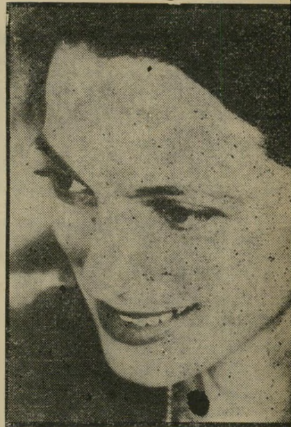
במאית רקנאטי אסור לראות, "ראשם"

סירטה הראשון של מירה רקנאטי, אלף נשיקות קטנות, שעלה על בד באולם רקנאטי שבמוסיאון תל-אביב, הוא כבר