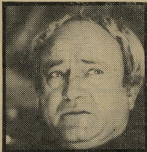
פסל תומרקין יוסט או גרינג?