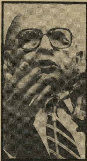
ראש ממשלה בגין להתחיל בחקירה

החלטה אומללה זו מבטאת בי אופן מדוייק את תפיסתו ההיסטורית של ראש הממשלה, כמו שהיא מבטאת את התפיסה ההיסטורית של התנועה שבראשה הוא עומד. בגין ותנועתו מאמינים כי לא מהלך המאורעות הוא הקובע את מהלך ההיסטוריה. הם גם לא מוכנים להפקיד את תיאור ההיסטוריה ופירושה בידי היסט