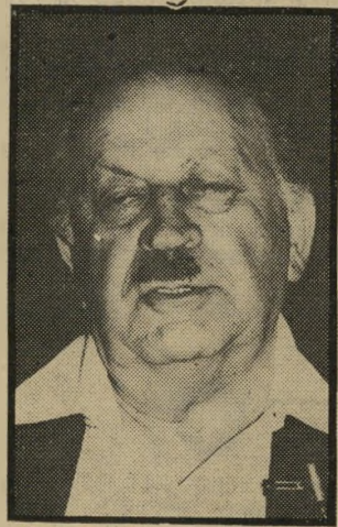
שר מרידור מקום בהיסטוריה

עכשיו כבר ברור מעל לכל ספק כי יש ממש בהמצאה, והיא תביא רווח עצום והצלה ליהודים, משום כך חייב איש העסקים והיום ה"מוכשר להתפטר מהממשלה, להשיג תחרר מכל עיסוקיו האחרים, ולי התמסר כליכולו לדבר האהוד והי