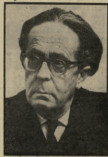
זידכרנ כסא דתי

התווך של בית-המשפט העליון. מאז לא מונה יותר עורך-דין פרטי ישירות לבית-המשפט העליון.