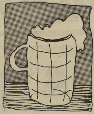
כוס אחת של בירה לשומר מימית

יש לי חידה עליזה אל אנשי הצב"ימית. החידה הולכת ככה, נא לשים לב למרטים: נכנס אדם לבית-המרוח, ומזמין כוס בירה. נותן לו המוזג את הבירה. האדם