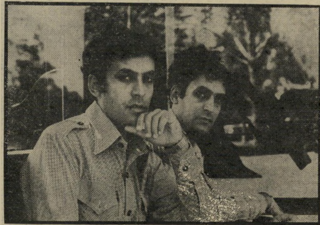
הרצל ובליפור חקק הבל הבלים אמר קוהלת

(המשך מעמוד 16) "קו הירקרק" / לטעת עצים ולגדל גני ירק / ואפילו לגור תחת "ריבונות נוכרית" / ואין זה נסבל שיישובינו יישארו תחת ריבונות מצרית? / האם ההתעקשות הזאת במחנה יש חדר טלוויזיה, אולם להקנת סרטים, חדר כוה, חדר ביליארד, קנטינה, מכבסה, בר וחדר-אוכל. עצתי לרבים מהישראלים הצעיריים שרוצים לעשות כסף טוב ב-