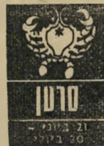
סרטן 21 ביוני - 20 ביולי

תוכנית לנסיעה תוסף עידוד ומצב-רוח משופר. כדאי לתכנן יחד עם בן-חזוג נפ' עה משותפת. מאחר ש' צפויים ביקורים מחו'ל, תוכלו להיעזר גם בידי' דים וקרובים הבאים אפשר להתחיל השבוע משם. במקום המגורים לתכנן שיפוצים ורכי' שות חדשות. סכום כסף נוסף יימצא לכם בקרוב על-מנת להג' שים תוכנית הקשורה לדירתכם. התפרצויות כעס של בן-חזוג או הילדים עלולות להכניס מתח רב.