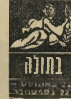
מחולה 22 באוגוסט - 22 בספטמבר

מצבכם אינו רע, מלבד כל מה שקשור בכספים. יש להקפיד להחזיר הלוואות, ולשלם חשבונות. דחייה של אלה עלולה לגרום לאי-נעימות רבה, ול' הסתכסכות עם אנשים קרובים. כבר כעת מדברים מאחרי גבכם על "חסכנותכם" ועל אי-נכונותכם לעמוד ב' התחייבויות. ומי כמו' כס רגיש לביקורת, גם אם זו אינה נאמרת בפניכם. מבחינה רומנטית צפויות השבוע הצלחות לא מטעות. שימו לב, אל תחמיצו.