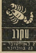
סקרבי 22 באוקטובר - 22 בנובמבר

למרות העיכובים המשוניים בתוכניות, מתי ברר שגם כך אפשר עדיין ליהנות ולמצות את כל הטוב מהחיים. במקום העבודה אתם זוכים לפופולריות, שב' חים לא מנשים מוש' מעים, וגם מופצים על' ידי אנשים המעריכים את מסירותכם וכישרו' נותיכם. גם אם בתחיל' לת השבוע יהיו יומיים מעייפים, תתגברו עלי' הם בקלות. הכינו מלאי של כוח ומרץ. מכיוון שהשבוע מתמצא את עצמכם נהנים ומטיילים מסביבה למטיבה.