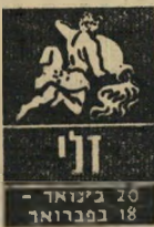
דלי 20 בינואר - 18 בפברואר

מרגישים שעליות על דרך טובה, למרות שזו תקופה של תוספת אחריות. בפרוייק' טים חדשים שאתם מתכננים, קחו בחש' בון את כל האפשרו' יות. הזחירות תשתלם, ותוכניותיכם יוגשמו. למרות האופי חמעת תמהוני המאפיין את' כס, תוכלו להשמיע על חסביבה ואף לשכנע אותם בראייתכם ה' בהירה והנכונה. הישג' כספי חיוני צפוי לכם, וזה זמן מצויין לייצג את עסקי חספ על בסיס איתן.