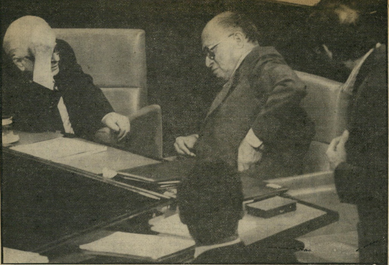
רגע אחרי הנאום: בגין נראה כבוכה, וירשובסקי, ארידור וארליך מסתכלים בדאגה

פחות מאדם אחד מבין כל אלה בני-אדם על פני כדור-הארץ הוא (המשך בעמוד 8)