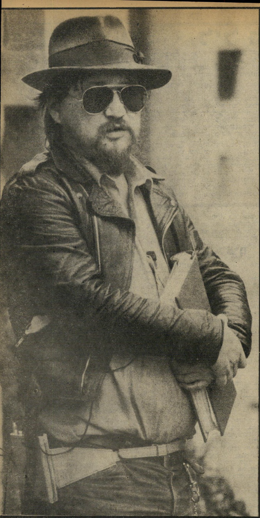
מרואיין ריינר ורנר פאסבינדר ניסיתי לעזוב את גרמניה

אנגלית, כמו "יואש" או "ליקי מארין" (שצולם באנגלית ואחר כך נעשה לו דיכוב גרמנית). האם נוח לך לעבוד באנגלית כמו בגרמנית?