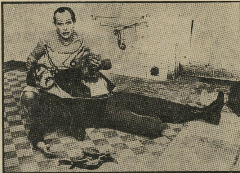
פאסבינדר (שוכב על הריצפה) כהומוסקסואל ב"צל המלאכים" להיות קדושים מן האפיפיור

אני חושב פחות על גיזן פורד ויותר על הקומדיה האנושית אבל אני חושב שמתוך סרטי אפשר יהיה להכיר את ההיסטוריה של גרמניה. אני רוצה בזאת מאוד.