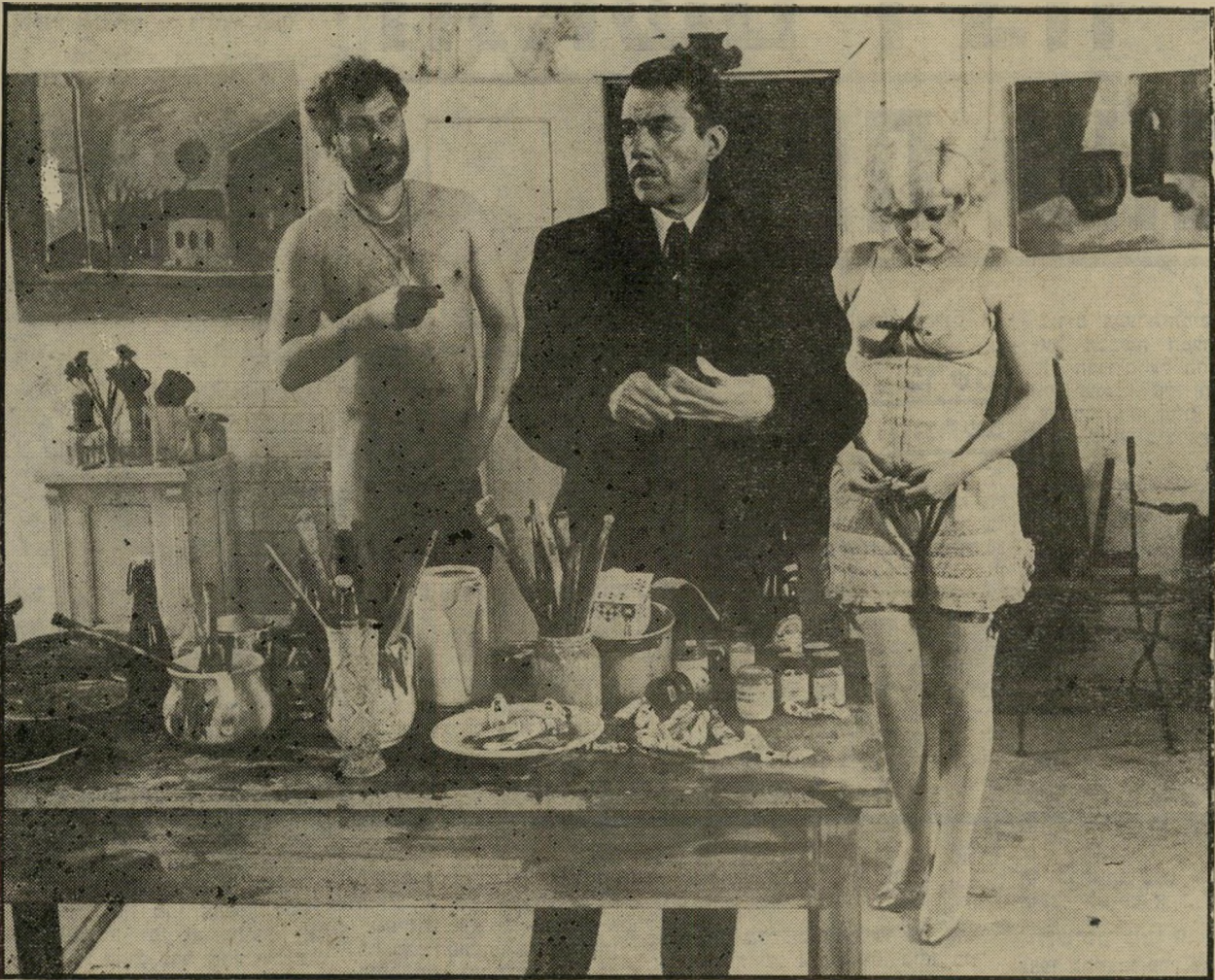
אנדריאה פראוד ודירק בוגארד (במרצו) ב"יאושו" אנגלית לקולנוע — גרמנית לפילוסופיה

היהודים נאלצו לנהוג באופן שלילי כדי להתקיים. זה אדיוטי לעשות מהעניין סוד