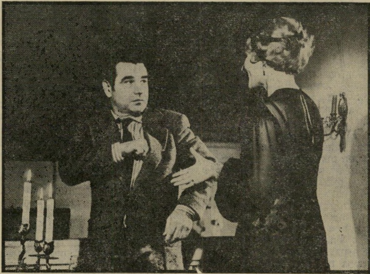
היזמיר טייט ורוזל צק ב"כיסופיה של ורוניקה זוס" הרופאה היהודיה למדה דברים נוראים

ה יכד הנורא של הקולנוע הגרמני, מני, הלוחם המושבע נגד המימסד, האיש שתקף את כל המוסכמות ואת כל החוקים המקובלים במולדתו, זכה להכרה רשמית. בגיל 36 קיבל הבימאי ריינר ורנר פאסבינדר את הפרס הגדול, "דב הזהב", בפסטיבל הסרטים של ברלין.