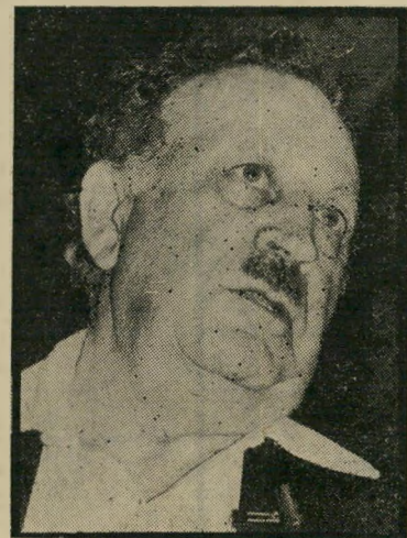
שר-על מרידור אורח אצל הדיקטטורית

הפיליפינים נמצאים אי-שם בי עולם ומלואו. השר יעקב מרידור יצא לפיליפינים למילוי שליחות ממשלתית עלומה. הכל החל, לדבר רי העתונות, כשהגברת הראשונה של הפיליפינים, אימלדה מרקוס, באה לניוירק ונוכחה לדעת כי צד מכוונת היצוא וההשקעות הישראלית עובדת ומצליחה. היא הזמינה למינה את עורך-הדין דוד רוטלוי, אז ציר ישראל ל-ענייני כלכלה בארצות-הברית, כדי לעזור לממשלה המקומית בהקמת מיבנה דומה. כתוצאה מביקור זה, יודעת העתונות הישראלית לספר, הוזמן השר יעקב מרידור לפיליפינים.