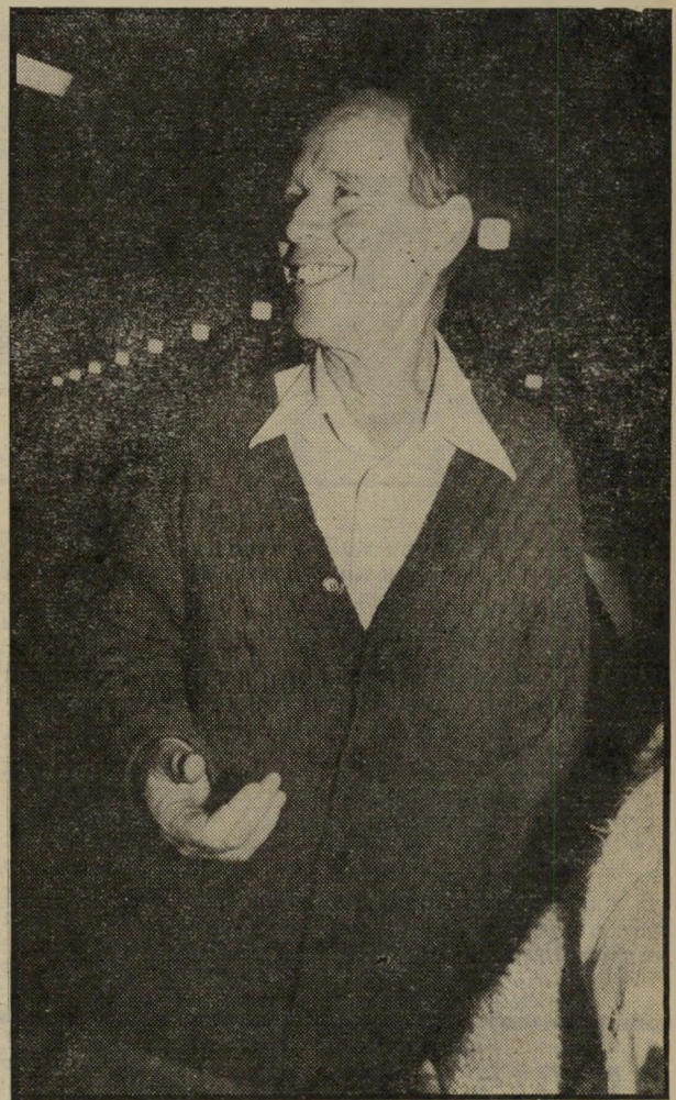
דיד ניב הגיאולוג, שחשף בתחילת שנות ה-70 את פרשת "נתיבי-נפט", שהשעירה את המדינה תקופה ארוכה, היה בין האורחים שבאו לחתונת בתו של פעיל.

ההסדר החדש בכנסת של חלוקה לחמישה מיוזגים, שבחלקם יכולים הח"כים ל" התבודד, ההוראה שגברים הייבים להופיע במיקטורנים,