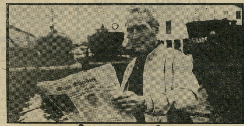
פול ניומן ב"בלי כוונת זדון" מי המנוול?

כך, בדריכלל המגמה אינה לעצור בעד המישטרה, אלא להיפך. וכאן העוקץ. אם מחליט קציני-מישטרה בכיר לנצל לרעה את העיתונות כדי לשבור אדם חף-משפט, כפי שקורה בסרט וכפי שיכול בהחלט לקרות במציאות — העיתון נותן עלולה ליפול בפח. היו טענות שכך קרה בפרשת אהרון אבו-חצירא, וגם בפרשת יורם ביכונסקי. זה נוהל פסול, ויש לגנותו. אך המנוול כאן הוא קציני-המישטרה, המדליף את המידע הכוזב — ולא העיתון, המפרסם אותו בתום-לב. "בלי כוונת זדון". אך יש לעניין צד המחייב חשבון-נפש גם בקרב העיתונאים. היחסים בין המישטרה והעיתונות על-לום להיות אינטימיים מדי, עד כדי כך