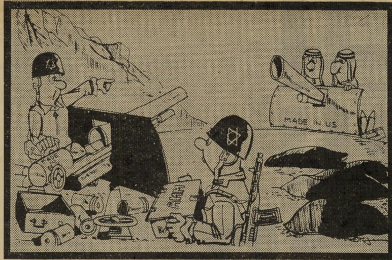
"לך לשאול מהם כמה פגזים. הם משתמשים באותו זגם!"

סעודיה משלמת תמורת הנשק שלה. ישראל אינה משלמת. היא מקבלת אותו כבאקשיש מן האמריקאים. מדוע מעוניינים האמריקאים בכך? כדי לתפוס זאת, יש לזכור את ההב-דל בין שני המישורים: הממלכתי והפרטי. אמריקה מספקת לישראל נשק וציוד צבאי אחר בשווי של כמיליארד דולר בשנה. אך היא משלמת את המחיר בעצ-מה. מי יוצא מרווח מכך?