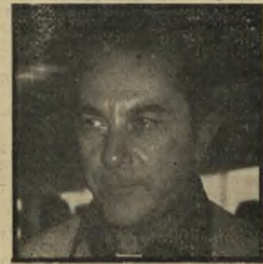
השגריר החדש הזהיר