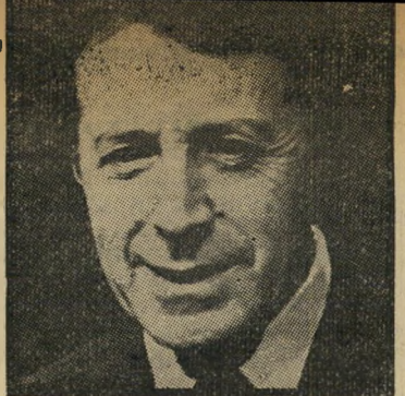
יינברגר הרשע עשה

מאז 1960 התהדרו יחסים אלה עוד יותר, ושוב אין כל אפשרות לסמן גבול כלשהו בין מומיני-הנשק ויצרני-הנשק, הגנרלים והתעשיינים, איליה-הון ואילי-המימשל. גנרלים, החולשים על הזמנות של מיליארדים, מתמנים למחרת התפטר-רותם מהצבא כמנהלי החברות שקיבלו את הזמנות. אילי חברות-הנשק, או הבנקים הקשורים עימן, מתמנים כשרים בממשלה, וממשיכים בתפקידם זה בעסקים כרגיל. הפנטגון הוא מרכז-המכירות של תעשיית-הנשק. שרים יוצאים לביקורים ממלכ-תיים בחו"ל, משמיעים הצהרות הגורמות להתרגשות בעולם, כשלמעשה המטרה הי-חידה של הביקור הוא למכור נשק. יור-המטות המשולבים של ארצות-הברית הוא, אולי, גדול סוחר-הנשק בעולם. גנרלים של יבשה ואוויר ואדמירלים מכל הדו-לרים גת משוטטים בעולם ומוכרים נשק. יש למהר ולהדגיש כי אין זה מצב אמריקאי בלעדי. מצב דומה מאוד שורר גם בארצות אחרות, גדולות, בינוניות