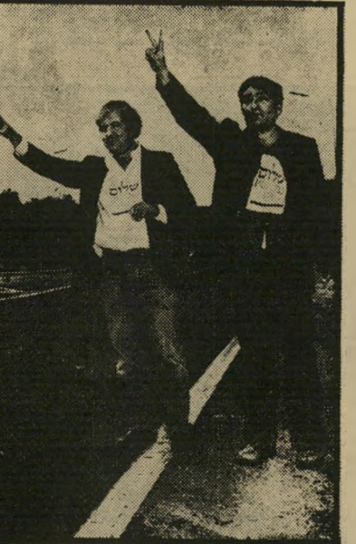
מונדי בהפגנת "שלוש עכשיו" * הסתכלות פילוסופית

המחזה האחרון שבו לא התעסקתי באנו הקטן שלי. אבל מאז הלכתי יותר פנימה. אל תוך עצמי. את יודעת למה? כי לא נוח לי בחוץ.