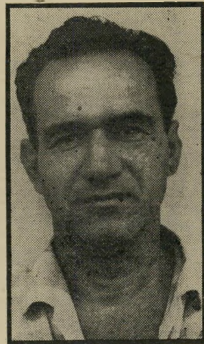
קורא ליבנה בלי פוליטיקה

אם התנועה הקיבוצית רוצה ב"המשך קיומה ובביסוס עקרונותיה החברתיים והביטחוניים, עליה לגיזור על עצמה התנזרות מפוליטיקה. כל חבר קיבוץ רשאי לנטות לכל דעה מדינית, אך זאת ללא הכוונה מרכזית - כתנאי בלי יעבור לחופש הדיעה והמצפון. אין להעלות היום על הדעת ביקורת פוליטית על דיעות, רעיונות ומחשבות בתחום זה, ואין לכנס מוסדות לשם כך. אין להחיל החלטות כלשהן על חברי קיבוץ בנושאים אלה.