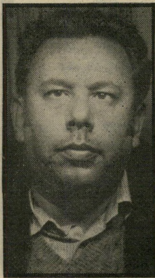
קורא לנראו גם מתמסרת

הקורא כועס על תנאי העסקת הנשים העובדות בארץ. כדי שעובדת בישראל תוכל ליהנות מעמד בעבודתה ולהתקדם, (המשך בעמוד 20)