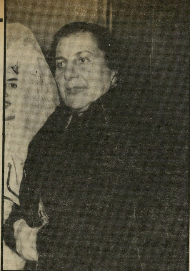
מתאכדת הלפרין קילתת אם