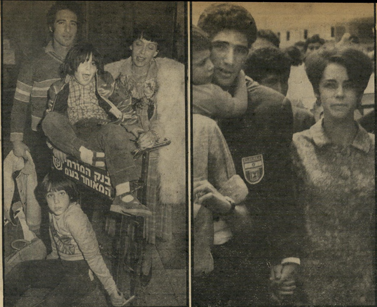
שפיגל עם מרגנית (1967), ועם מרגנית, אינור ורון (1982) היא צריכה להתרגל לגיורא חדש!

הבנתי שמהיום והלאה אין לי חשק ללכת יותר לאימון. אתה מתכוון לכתוב ספר על הכדורגל?