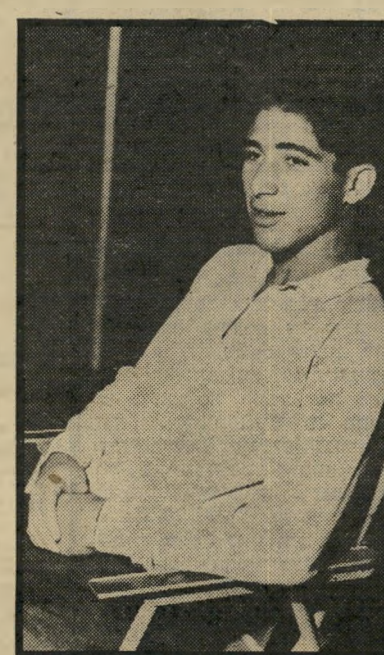
שפיגל בראשית הקאריירה (1963) בעיטה ראשונה בגיל שנתיים

● מה היו היחסים בינך וכין גניש? לא היו לי יחסים עם גניש. כל הקשר