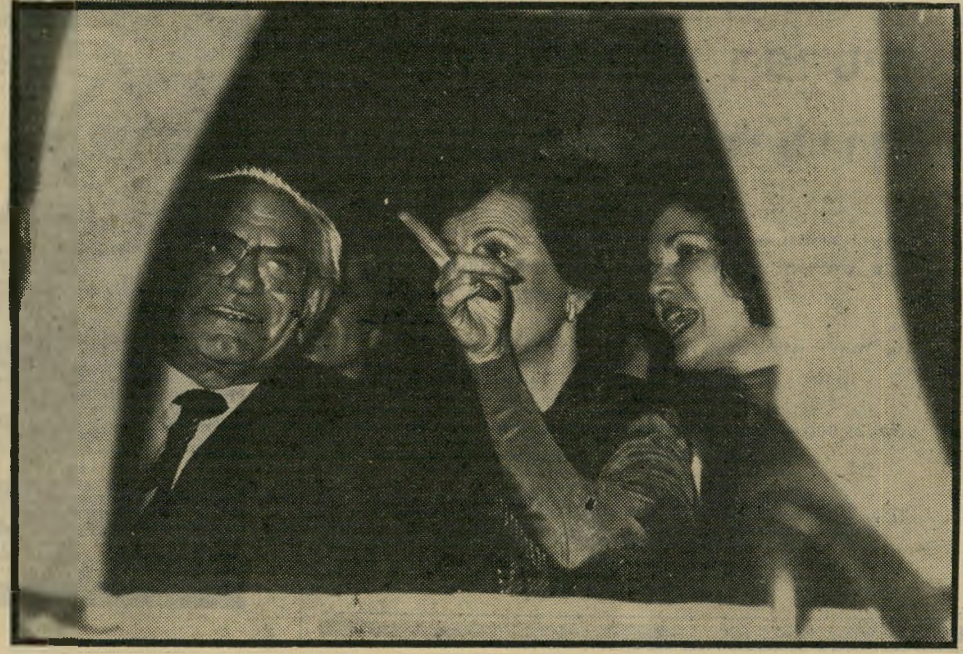
מצביעה בידה על גוליה של דוגמנית שעמדה כימעט מעליה. אופירה נכחה בתצוגה שנערכה בשבוע-האופנה, לצידם של התעשיין ישראל פולק ואשתו (במרכז). בעוד שישראל פולק נהנה מהרגליים החטובות, לא ידוע מה אמרו שתי הנשים.

יושבראש נשיאות המיפלגה הליברלית, השר יצ"חק מודעי, הידוע בתגובותיו תיו הספוטניות, נוהג לעזוב בהפגנות וברמתיות את ישיבות המיפלגה ברגע שי מדברים נגדו, ולשוב אחר-כך בשקט למקומו. בישיבת המועצה הארצית של המיפלגה, שנערכה בבית ציוני אמריקה בתל-אביב, הצביעו רוב הנור כחים בעד הצעת הצעירים לדון במצב המיפלגה לאור ה-פירסומים השונים בעיתונות.