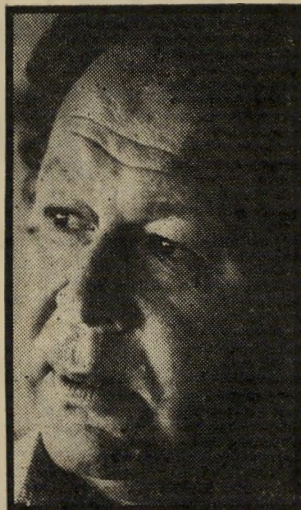
אזוף במינוזאים גור תוסך מיותר

אני, האזרח הנבוך, שואל: הח"כ מרדכי גור אמר כי אלילה לישראל להסתבך במילחמה מיותרת. שימו