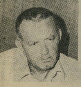
ITZHAK ZAID, Brigadir-General (Res.) Former Commander of the Civil Defense Forces. Command the Ministry of Defense. (the Central Command)