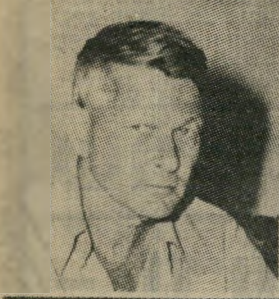
AVRAHAM (BREN) ADAN, Major-General (Res.) Former Commanding Gen. of the Southern Command; Former Commanding Gen. of the Armoured Corps and R Defense Attache in Washington; Editor-in-Chief