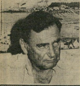
YOHAI BEN-NUN, Rear-Admiral (Res.) Former Commander of Israeli Navy; General-Manager of the Oceanographic Institute.