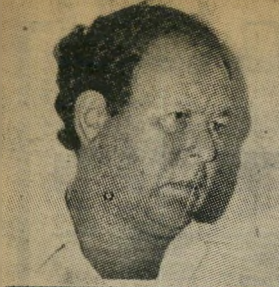
MORDECHAI (MOTA) GUR, M.K. (Member of the Foreign Affairs and Defense Committee) Lieutenant-General (Res). Former Chief of General Staff of the Israel Defense Force President of the Editorial Board.