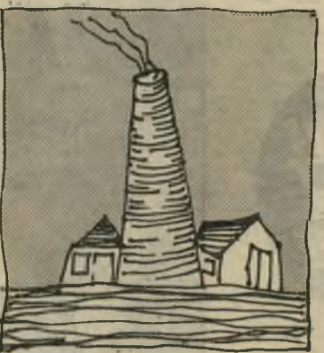
זיפצ'י גרוד סבידור והורביץ

כאשר נשאל צ'רצ'יל על-ידי הסוציא-ליסט מדוע הוא עומד כך ומסתיר, השיב: