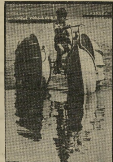
אופני-מים כל ילד יכול

ספורט חדש פשט במימיה-החופים של אוסטרליה: שיט באופני-מים.