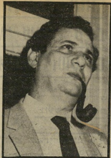
שר-האוצר ארידור המיסים שבדרך

אני רוצה להביא לפניכם מידע כלכלי מעודכן. לאחרונה ראיתי את שר-האוצר, יורם ארידור, כמה פעמים. הוא עישן מיקטרת וגם היה מרוגז או כועס. הוא חשב שאחרי ההישג של 1981 הכל ילך יותר חלק. הוא טועה. דווקא אלה שחשב שלא יעשו לו בעיות, עושים לו. עכשיו הוא לא מסתדר עם השרים בעניין תקציבי המישרדים: הם רוצים יותר, הוא לא מוכן. בצדק, הולך ומתברר שגם העזרה-בהתנדבות של השר לתיאום כלכלי, יעקב מרידור, לא תעזור לו, לארידור. הוא ברוגז עם הממשלה. עובדה: הוא לא מגיש את הצעת-התקציב לדיון בממשלה. לראש-הממשלה איכפת. ולכן יידחה הדיון על התקציב שוב. אחרי שיואשרו תקציבים לשלושה חודשים ולשישה חודשים, יתברר שוב שאין מכפיק כסף, שוב יהיה צורך להדפיס. כישון הכלכלנים: יגדל עודף הביקוש הממשלתי. כשזה יגדל, לא יהיה מנוס מהטלת מיסים נוספים. וזה יקרר למרות ההבטחות שלא תהיינה גזירות כלכליות.