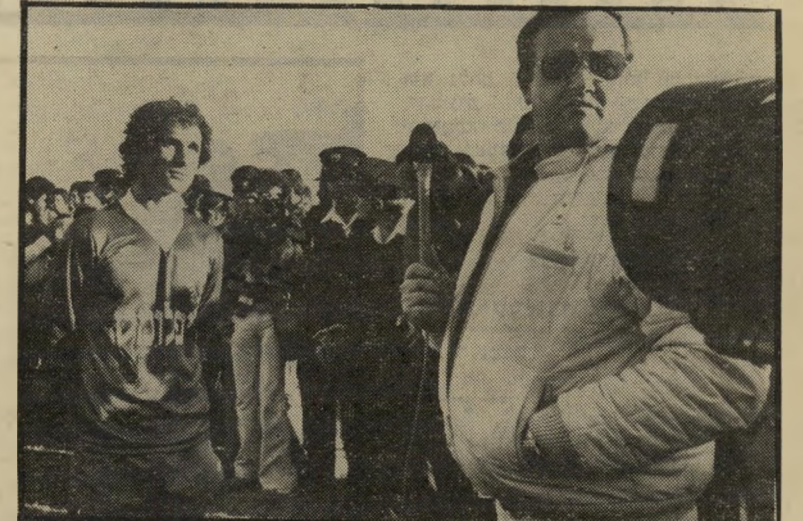
מועמד שילון בפעודה כ"ט בנובמבר לטלוויזיה

מישרת מנהל מחלקת-התוכניות בטלוויזיה. מאבק זה מתנהל עם ועד עובדי הפקה' חדשות, שהורה לעובדים שלא לשתף פעו' לה עם שפייר, עד למציאת פיתרון המנח את הדעת למינויים בצמרת הטלוויזיה. משבר שלישי בין לפיד ועובדי רשות- השידור מתמקד בכוחותו להקים בטלוויזיה