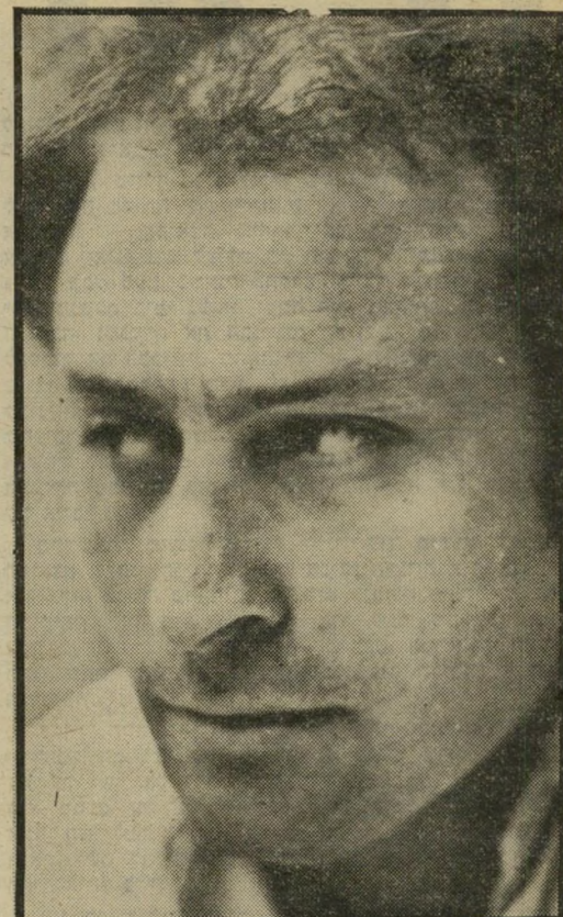
פרופסור מרדכי שני:

העניין חשוב לי ואני רוצה לטפל בו. אם לא יאפשרו לי, לא אשאר בתפקיד רק בשביל ההילה המפוקפקת של סגן-שר.