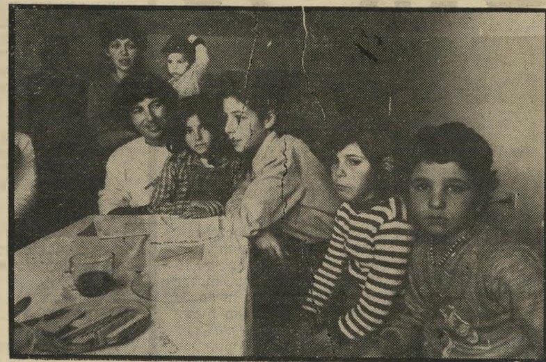
פרחן בחיק מימשחתו*

„כשאני הגעתי לשם, הפיקו מהימה 600 טון דגים. כשעזבתי היתה התפוקה 2600 טון.“ פרחן אוהב לספר על חבריו הערביים.