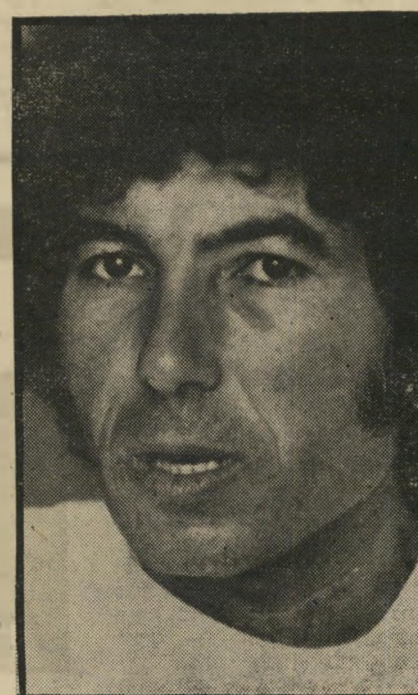
מורד אבי פרחן

„זוהי קבוצה שכסף לא מעניין אותה. לצערי עם ישראל אינו מבחין ביניהן.“