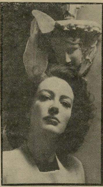
כוכבת ג'ואן קראופורד המקור

ואכן, כריסטינה, שלא זכתה אפילו באגורה שחוקה אתה מירושת אמה העשירי, חיטלה עימה את כל החשבונות, וציירה