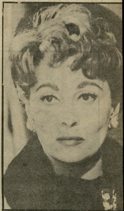
שחקנית פיי דאנאווי בקראופורד החיקרי

כמעט התנדבות. יתכן מאוד שריקעם של האנשים הוא שעזר להם להיראות אמניים כל-כך לפני המצלמה. כנהוג בסרטים ישראליים, כולם עבדו כמעט בהתנדבות, עד אשר זכה הסרט בתמיכה של הקרן לעידוד סרטי איכות, ורק אז אפשר היה לשלם לחלק מן המשתתפים חלק מן השכר שהגיע להם. בזמן ההסרטה לנו כל אלה שמתגוררים רחוק מדי מנס'ציונה אצל אלה שמתגוררים בסביבה, אוכל ושתיה היו בעיות שבפיתרוןן השתתף הצוות ולא מיוזמואים מבחוץ, וזמן ההסרטה היה מוגבל — גם משום שאי אפשר לדרוש מאדם העובד למחיתו שיקדיש יותר מפרק זמן קצר לעבודת התנדבות. אין אלה תנאים להפקת