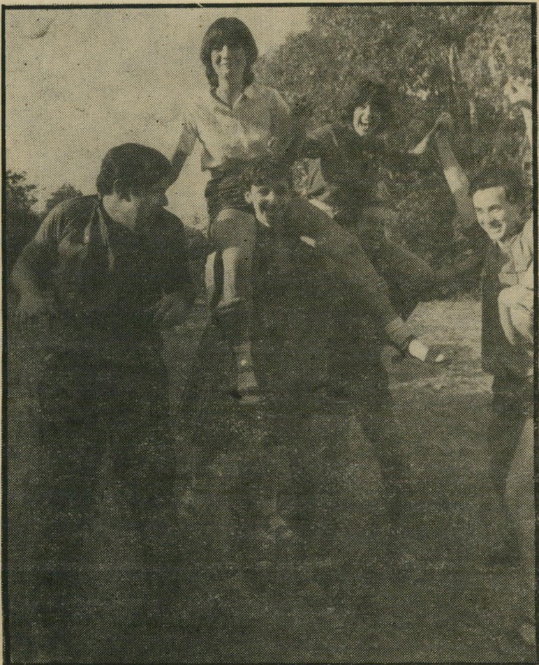
חברי תנועת הנוער ב"נועה בת 17" — בחברה שהקונפורמיזם הפך למעלה

מתוך העימות האישי החריף, צצות החוצה, ומוטות בועם, כל ההאשמות שרווחו באותם הימים בתנועת העבודה כולה: השתעבדות לאמריקאים מצד אחד וסטאליניזם מצד שני, שכירת אנשי אגרוף ושימוש בעולים חדשים למטרות אלקטוראליות, מאניפולציה של קולות ודיכוי המיעוטים. בקיצור, כל מה שהסעיר את המדינה בעשור הראשון עולה כאן על פני השטח ומתמזג עם הבעיות האישיות של ה"שלושה: האשה השתלטנית מדי הדורשה כי הבית כולו ינהג על פי דרכה, הבעל