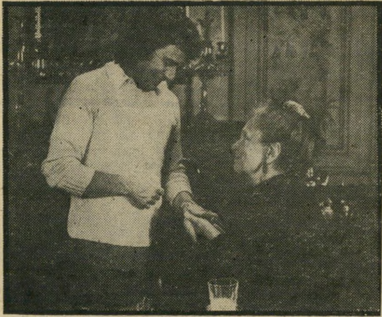
מור ופיצג'ראלד: סבתא שווה מיליונים

גורדון כותב דיאלוגים משעשעים מאד, ומזמין את שחקניו לירות את ההצחקות בקצב רצחני, כדי שלא יהיה ספק בידי הצופים להרהר במה העניין. חוץ מזה, הוא ממציא גם סיפור אהבה, בין ארתור ובין בת פרורים עניה אבל מסורה, האוהבת את אביה ויודעת לעמוד על דעתה. זאת כדי שיהיה לעלילה שלד שיקדם אותה בדרכה אל המסקנה הסופית, האומרת שמי שרוצה באמת את הכל, גם יזכה בכך.