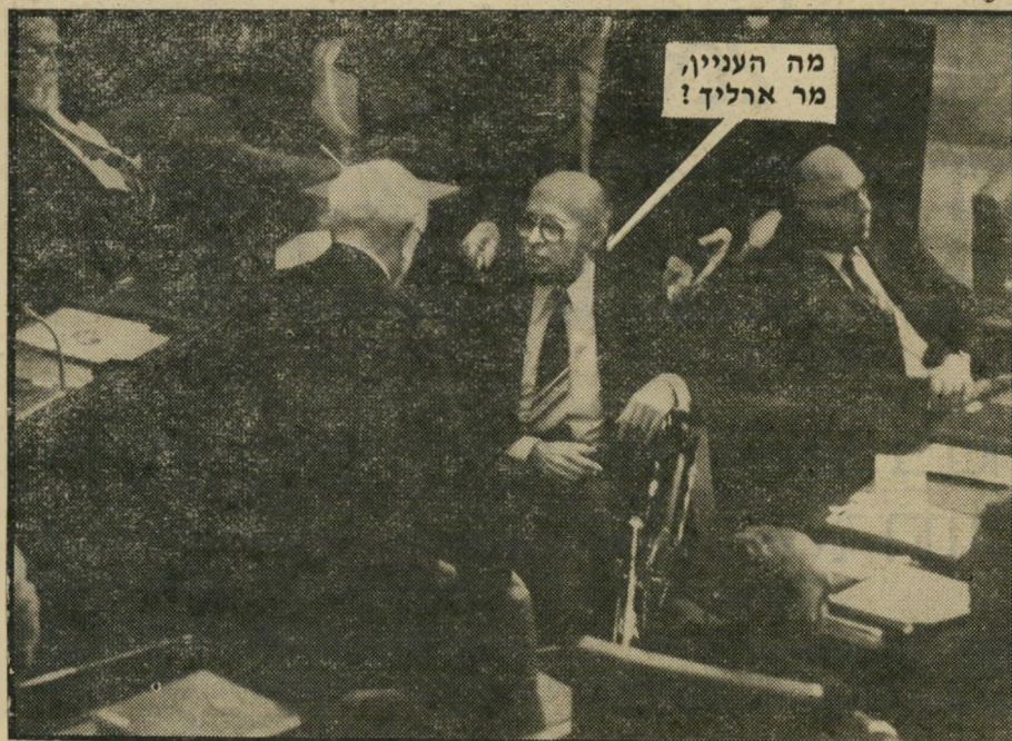
מה העניין, מר ארליך?