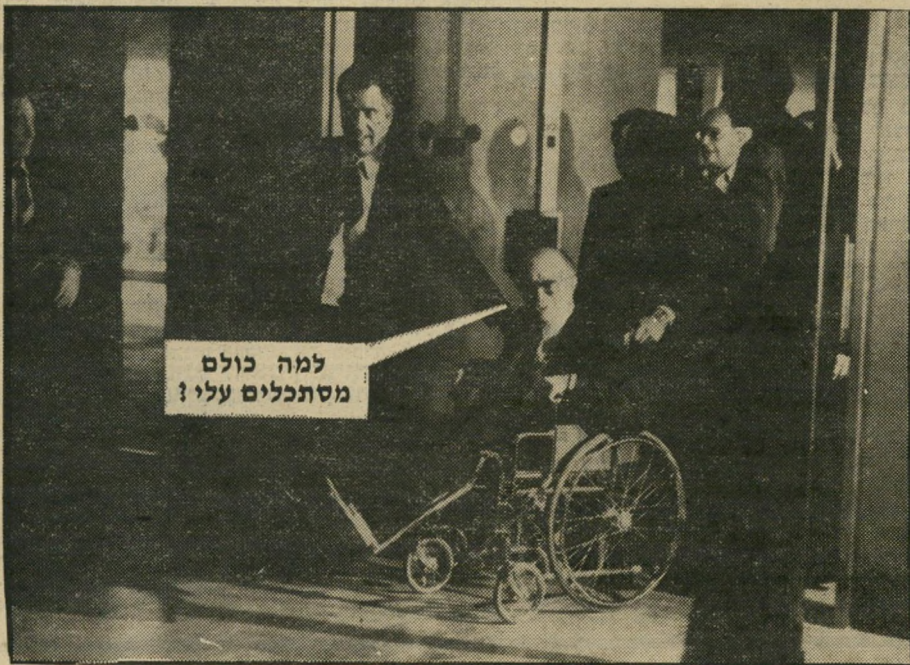
למה כולם מסתכלים עלי?