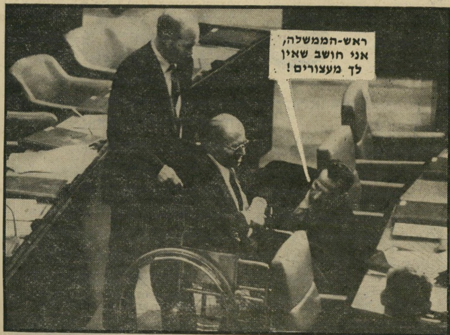
ראש-הממשלה, אני חושב שאין לך מעצורים!