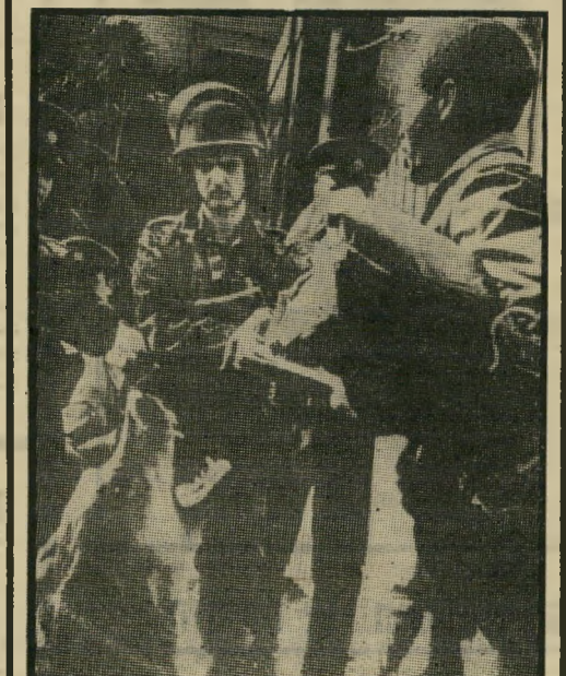
פועל-דחק אפריקאי בשכיתה חקירה נגד "כור"

דיווח ישיר שהגיע לעולם קטן מפאריס, העלה שהאינטרנציונאל הסוציאליסטי בודק עתה האשמות על פעילות רבה של מוסדות הסתדרותיים בדרום-