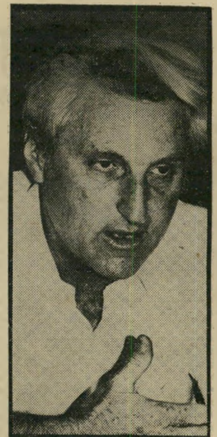
ראש-עיריה להט זיהונו במידדחוב

בסיור שערכתי בכמה שבתות ברחוב דיונגוף הסתבר לי להפ-תעתי, כי הכביש נתפס על-ידי בעלי המיסעדות שברחוב, שהצי-בו בו שולחנות וכיסאות, והפכו את הכביש למקום הגשת אוכל. הדבר גורם זוהמה רבה, ריחות תבשילים באוויר ותחושה קשה. צר לי לציין כי שום פקד עי-רוני לא נראה במקום. אין ספק שהדבר מחטיא את מטרתו. נתן וולוו, תל-אביב