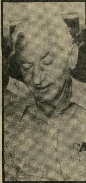
מזכ"ל בר-לב מועמד לכל עת

לחיים בר-לב יש שיער לבן, כמו שהיה לבן-גוריון. הוא מזכ"ל מיפלגת-העבודה, כמו שהיתה גול-דה מאיר. הוא היה רמטכ"ל, כפי שהיה יצחק רבין. הוא שבר את רגלו, כפי שקרה למנחם בגין. ו-