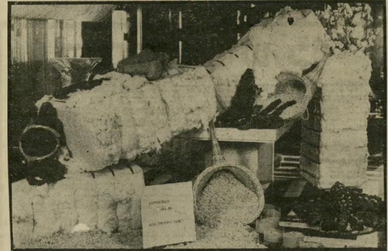
לחם מקמח כותנה הכותנה הגרעינים והלחמניות

מתברר שזו רק תשובה חלקית, לא מלאה. כסוף השבוע חזרו גם