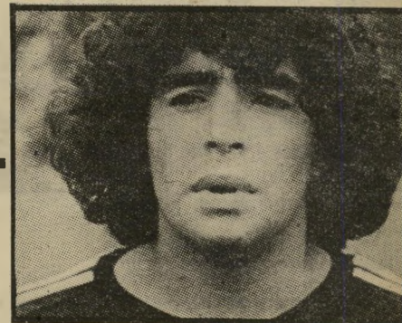
כדורגלן מאראדונה מי התקור?

לעומתו, מאראדונה מרשה לעצמו להת-נהג בחוצפה, דבר שלא מרשה לעצמו אף כדורגלן אחר. למישחקים הוא מגיע ב-מכונתו הפרטית ולא עם שאר חבריו השחקנים, ולא פעם נאלצה המיטרה להלץ אותו מידי המון השטתער עליו בהערצה. ארגוני-הגילוי רבים חוששים שהוסר-המיש-מעת שלו, והוסר-הכבוד שהוא מפגין כלפי מולדתו, יהיה בעוכריו.