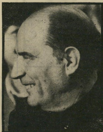
נשיא מיטראן שערי המניות ירדו

מסיכומים של הפרציה של הבורסות מתברר, שישראל השיגה שיא ב"1981. עלייה ריאלית של כ"27% במניות הנסחרות בבורסה, וזאת לעומת עליות מתור גות או ירידות בבורסת הוותיקות. מדד המניות בבורסה של ניו-יורק ירד ב"8. המדד המפורסם