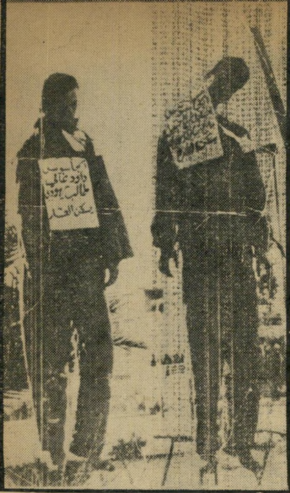
האח (מימין) אחרי תליתו „אמרו שהוא מרגל ציוני“

אחרי שנרצח בעלה, ובמשך כל הזמן הוא התעללו בה החוטפים.