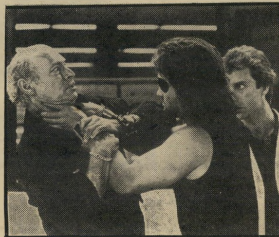
ראסל וואן-קליף: נבואת-זעם מפוקפקת

לדעת. בקופה הוא מוכיח את עצמו. וכמי שעינו פקוחה לנעשה מסביב, כבר מצטייד בלמונדו לקראת העתיד. חברת ההפקה שלו מסרבת למכור את סרטיה לסלוווייה, כדי שלא יתחרו עם סרטיה בקולנוע. לעומת זאת, הוא כבר הקים חברה של הפצת קאסטים וידיאו, המציעה את הסרטים שהוא עשה, וסרטים שעליהם קיבל זיכיון. בינתיים זה לא תופס עדיין את מקום החוויה המשותפת של צפיה בסרט, באולם קולנוע, אבל בעתיד זה יכול לקרות. ובלמונדו רוצה בהחלט להיות מוכן לעתיד.