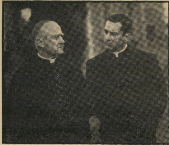
דהנירו וסיריל קוזאק: מאופק להפליא

הזאת יותר ממימד שטחי, ומה שמור יותר, הוא אינו מקנה לכל המיבנה שלו קצב קולנועי של ממש. הסיפור נמשך ונמשך זמן רב אחרי שהתיזה שלו ברורה לגמרי. לכל אורכו נידמה כי עתיד לבוא היא עוצר נשימה שאינו מגיע. זאת ועוד, השרירותיות של התפתחות העלילה, שבה דמויות מתחסלות כדי להקל על מלאכת הכותבים והבימאי, אינה עוזרת הרבה.