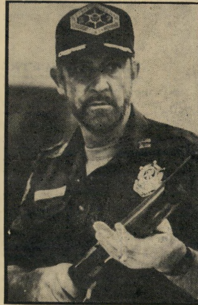
שון קונרי בפעולה שריף בודד

יש כמובן מי שיאמר, כי בתנאים שבהם הוא עובד כיום, קשה לצפות שמשוה ישתנה: בלמונדו מעורב בתהליך היצירה של סרטים משלב מוקדם, דורש תסריטים תפורים לפי מידה ואף מקבל אותם. עד כמה התהליך הזה עוזר לאמנות, זאת אין