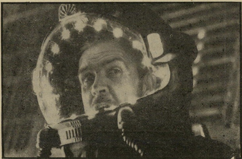
שחקן שון קונרי ב"אאוטלנד" בקרני לייזר במקום בכדורים

"חנאי החיים משתנים, הטבע האנושי לעולם נשאר," טען קונרי באוזני מראיין, בשעה שצילם את הסרט. הוא הצביע על הדראמה היוונית, שעסקה באותם הנושאים היסודיים שבהם אנו מטפלים גם היום — בצע.