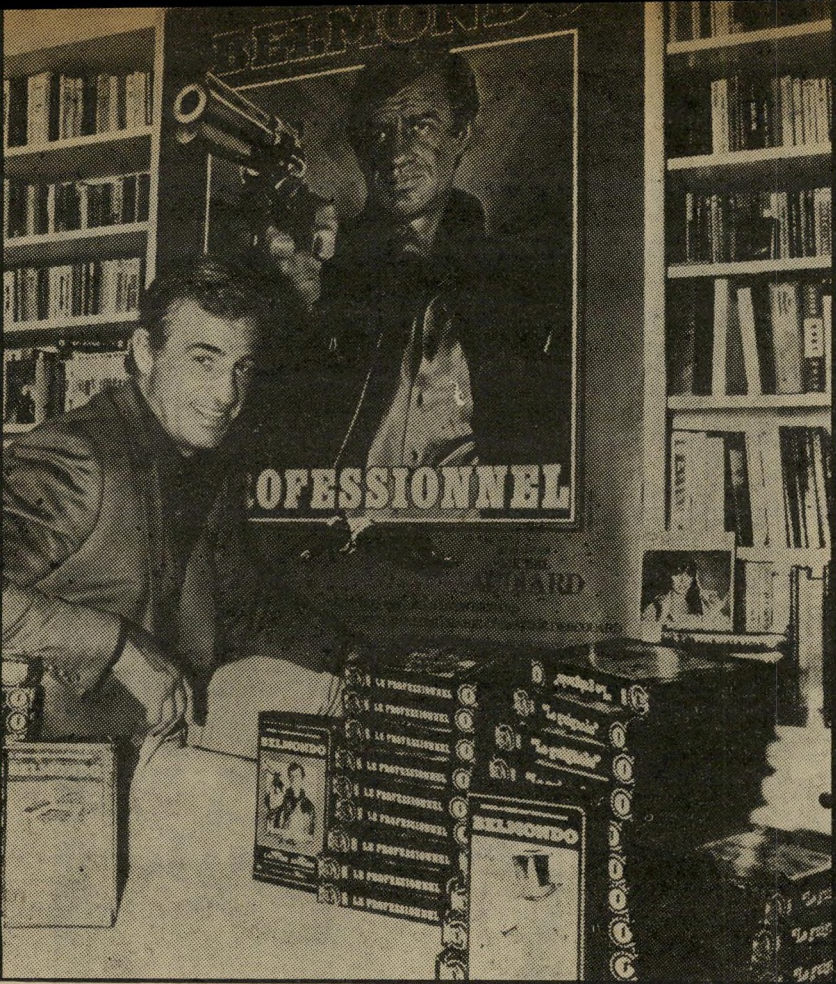
מפיק ז'אן-פול בלמונדו ליד כרזת סרטו "המיקצונו" וקאסמות של סרטיו 1982 — איליל הנשים בכל הדרו

כוכב הקולנוע הזול ביותר בצרפת הוא ז'אן-פול בלמונדו. הוא אינו משתכר אפילו אגורה אחת בכל הסרטים האחרונים שעשה, אבל אין זאת אומרת שהוא פנוי להצעות ומחפש עבודה. כי הכוכב בלמונדו קשור