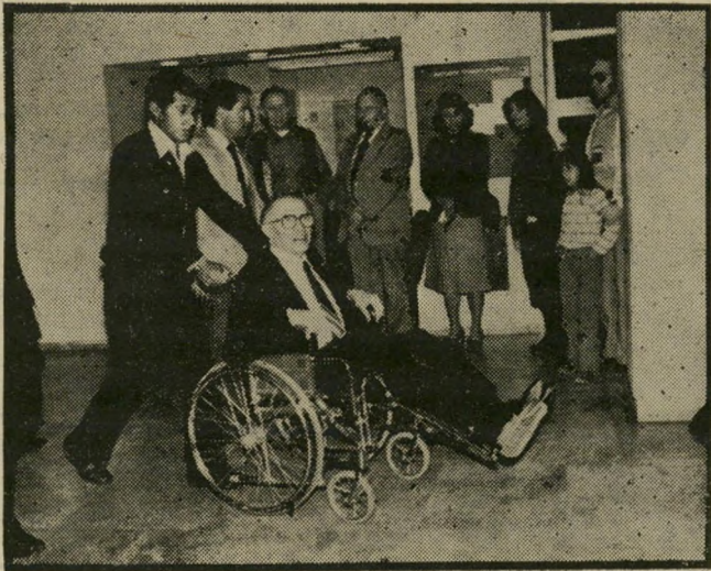
מנחם בגין ידיות באמבטיה מאגד

יחאל קדישאני, ראש-לישכת ראש-הממשלה, התבקש לאשר את הידיעה על הסתייעות מישפט בגין באירגון יד שרה. הוא התקשר עם עליזה בגין, המאושר פוזת בבית-החולים, והיא ביקשה ממנו לאשר את הפרטים. היא גם ביקשה שהעולם הזה יתקשר עם אבי שטרן מאירגון יד שרה ויקבל