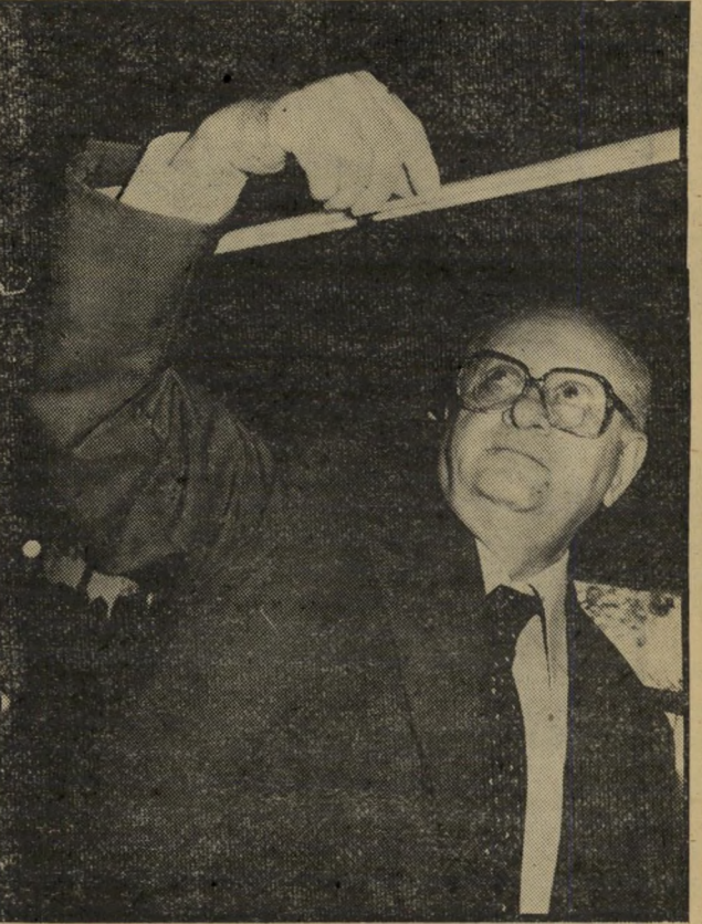
מפנה ארליך כסף דני

תוכנית פאהד, הדיוויזיות של האפיפיור והרמז הסובייטי. הצעה שלכם היא שאתם, הישראליים, הנכם אירופים. אתם